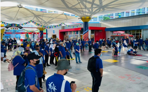
Berkumpul di Foyer Legoland Malaysia untuk Acara Sukaneka Hari Keluarga 2022.